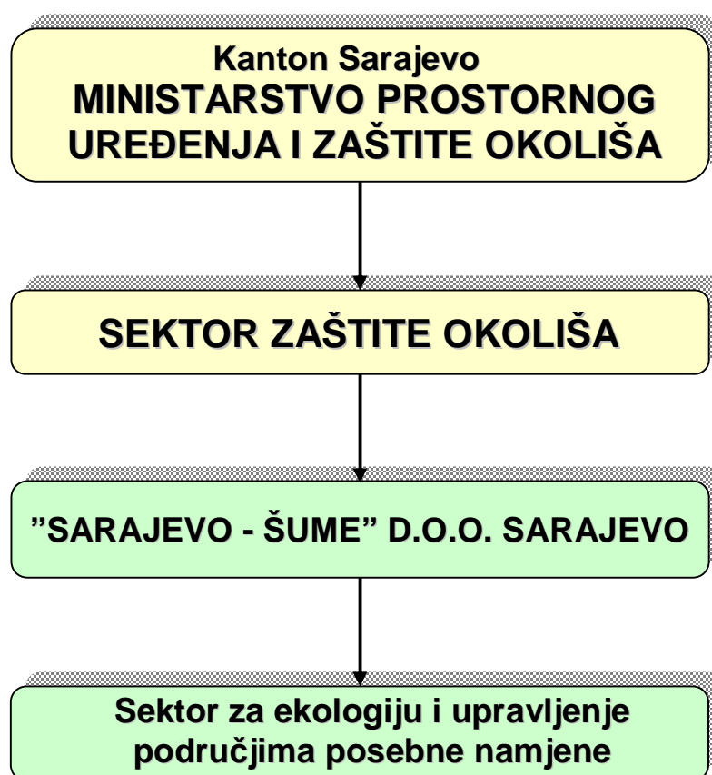
Grafikon 1. Institucionalni okvir za upravljanje

Finansiranje i svi drugi aspekti rada upravljačke institucije su regulirani posebnim aktima i sporazumima koje je Kantonalno ministarstvo za prostorno uređenje i zaštitu okoliša sklopilo sa upravljačem – Sarajevo-šume d.o.o. Sarajevo. Ovi sporazumi trebaju imati karakteristike dinamičnih dokumenata sa mogućnošću aneksnih dopuna shodno dinamici razvoja zaštićenog područja i potrebama Upravljača.