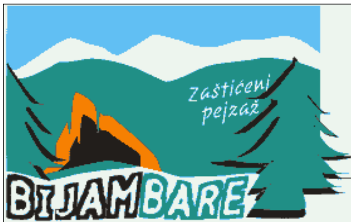
Slika 2. Logo zaštićenog područja «Bijambare»

Jedna od bitnih komponenti je i vizualni znak ovog područja koji je prikazan na slici 17. On se sastoji od stiliziranog crteža pećine i natpisa «Bijambare» koji će omogućiti da svi proizvodi iz ovog područja budu lako prepoznatljivi.