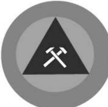
Slika 28 JEDINICA ZA SPAŠAVANJE IZ RUDNIKA