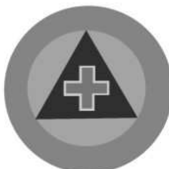
Slika 20 JEDINICA ZA ZAŠTITU ŽIVOTINJA I NAMIRNICA ŽIVOTINJSKOG PORJEKLA