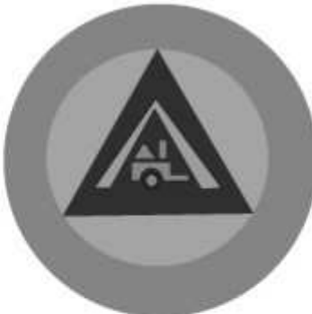
Slika 27 JEDINICA ZA SNABDJEVANJE