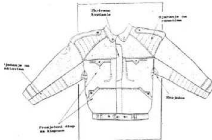
Slika broj 6