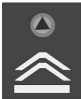
Slika 54 KOMANDIR ODJELJENJA