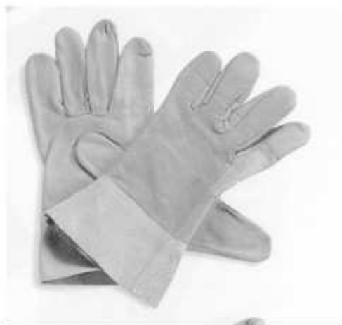
Slika broj 10