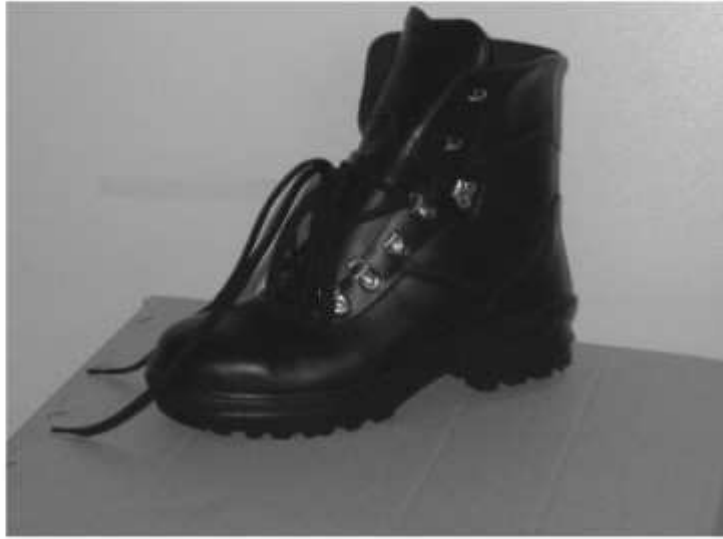
Slika broj 16