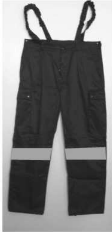
Slika broj 5