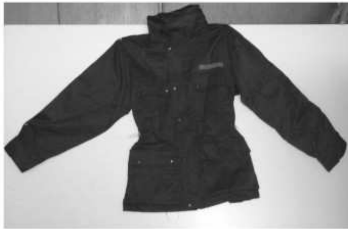
Slika broj 8