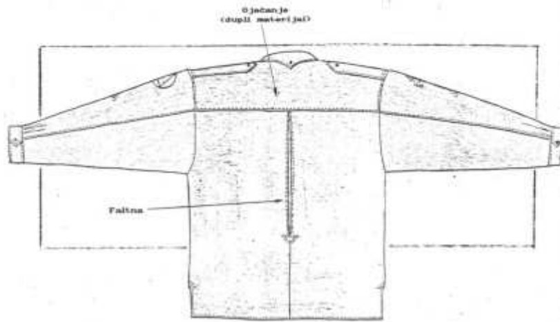
Slika broj 3