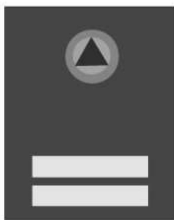
Slika 39 ČLAN KANTONALNOG ŠTABA CIVILNE ZAŠTITE