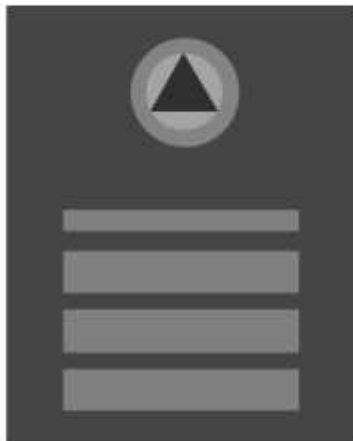
Slika 43 KOMANDANT ŠTABA MJESNE ZAJEDNICE