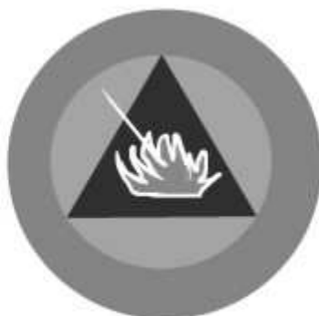
Slika 19 JEDINICA ZA ZAŠTITU OD POŽARA