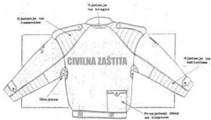
Slika broj 7