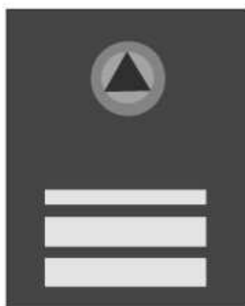
Slika 38 NAČELNIK KANTONALNOG ŠTABA CIVILNE ZAŠTITE