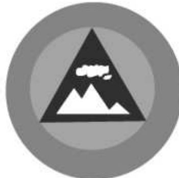
Slika 24 JEDINICA ZA SPASAVANJE SA VISINA