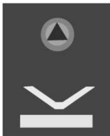
Slika 51 STRUČNA SLUŽBA KANTONALNOG ŠTABA CIVILNE ZAŠTITE