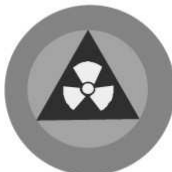
Slika 18 JEDINICA ZA RHB ZAŠTITU