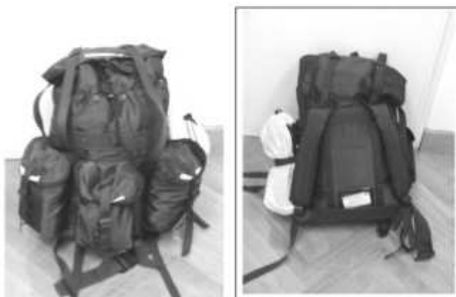
Slika broj 15