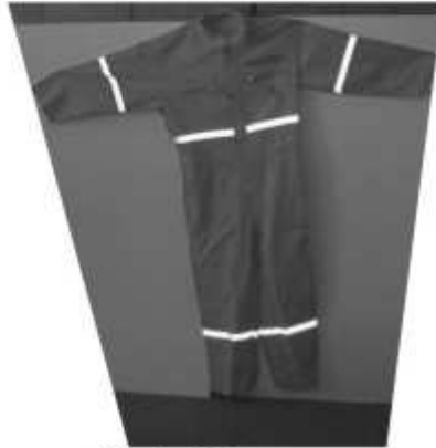
Slika broj 12