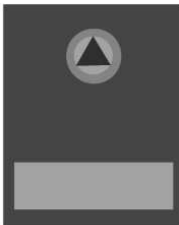
Slika 49 RUKOVODILAC SLUŽBE ZAŠTITE I SPAŠAVANJA