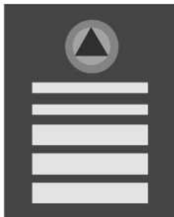
Slika 34 KOMANDANT FEDERALNOG ŠTABA CIVILNE ZAŠTITE