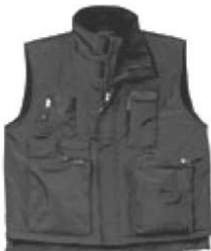
Slika broj 14