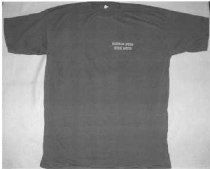
Slika broj 9