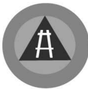
Slika 30 JEDINICA ZA GRADEVINSKE POSLOVE