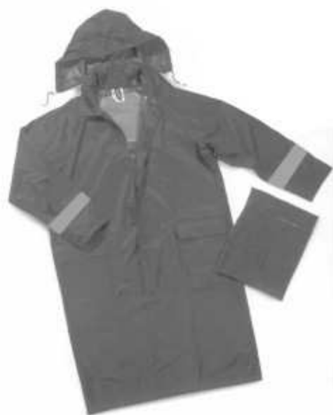
Slika broj 11