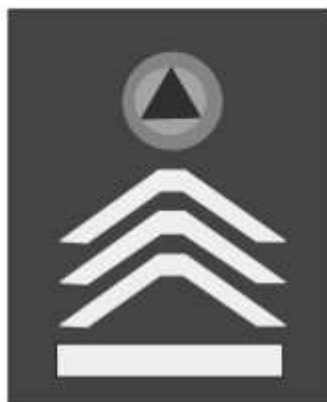
Slika 53 KOMANDIR VODA