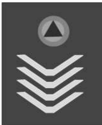
Slika 33 POVJERENIK CIVILNE ZAŠTITE