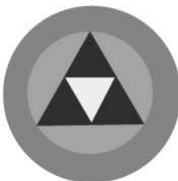
Slika 21 JEDINICA ZA ASANACIJU TERENA