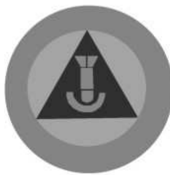
Slika 22 JEDINICA ZA UNIŠTAVANJE NEEKSPLODIRANIH UBOJNIH SREDSTAVA