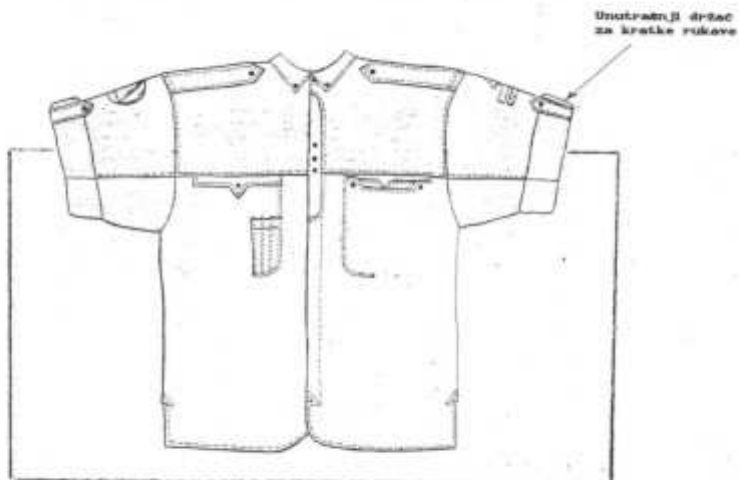
Slika broj 4