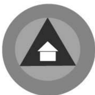
Slika 31 JEDINICA ZA ODRŽAVANJE STAMBENIH OBJEKATA