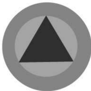
Slika 56 OPČI ZNAK CIVILNE ZAŠTITE