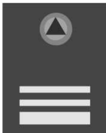
Slika 40 KOMANDANT OPĆINSKOG ŠTABA CIVILNE ZAŠTITE