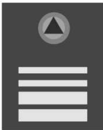
Slika 37 KOMANDANT KANTONALNOG ŠTABA CIVILNE ZAŠTITE