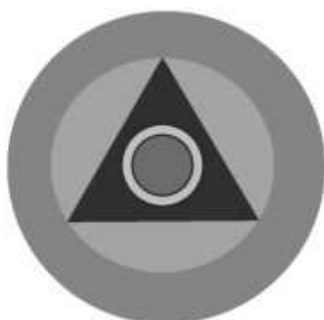
Slika 29 JEDINICA ZA KOMUNALNE POSLOVE