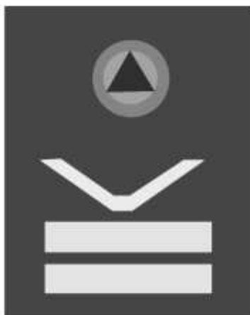
Slika 50 STRUČNA SLUŽBA FEDERALNOG ŠTABA CIVILNE ZAŠTITE