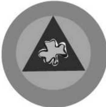
Slika 25 JEDINICA ZA ZAŠTITU BILJA I BILJNIH PROIZVODA