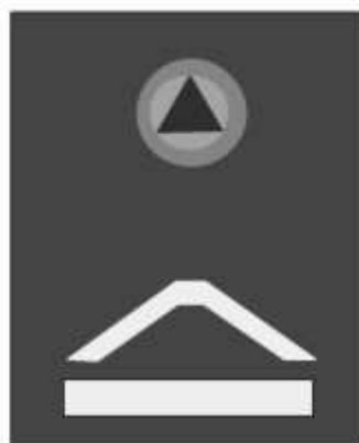
Slika 55 VOĐA TIMA