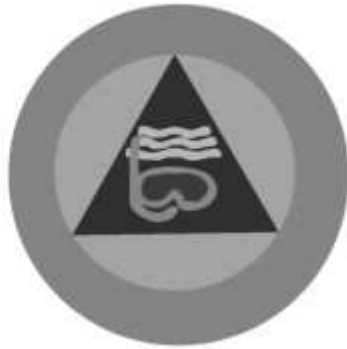
Slika 23 JEDINICA ZA SPASAVANJE NA VODI I POD VODOM