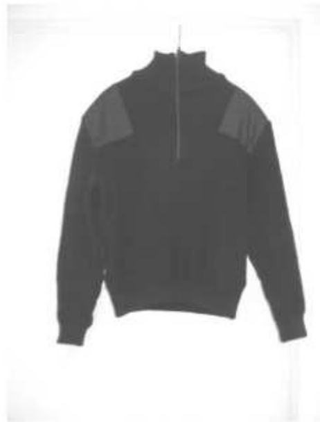
Slika broj 13