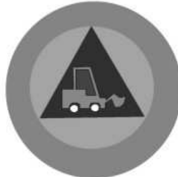
Slika 26 JEDINICA ZA SPASAVANJE IZ RUŠEVINA