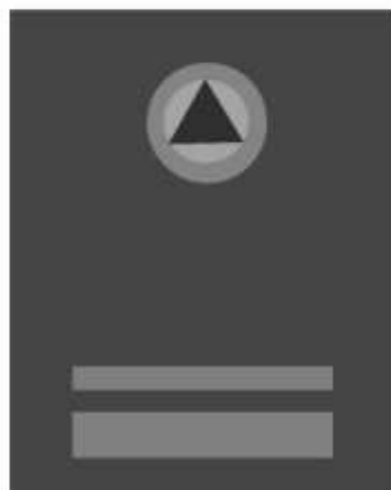
Slika 45 ČLAN ŠTABA MJESNE ZAJEDNICE