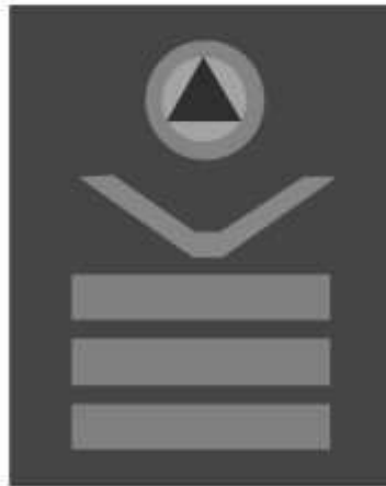
Slika 46 KOMANDANT ŠTABA PRIVREDNOG DRUŠTVA