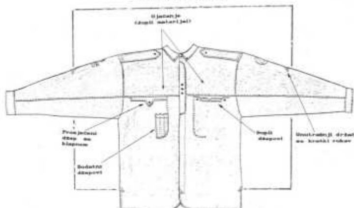
Slika broj 2