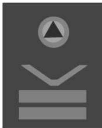
Slika 47 NAČELNIK ŠTABA PRIVREDNOG DRUŠTVA